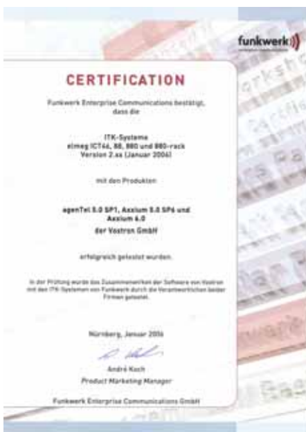
Zertifizierung bei FEC