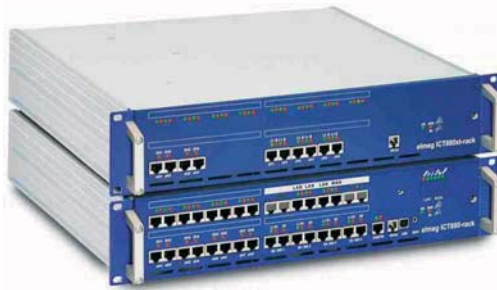
elmeg ICT880 Rack

Investitionssicherheit und einfache Konfiguration spielten ebenso eine Rolle in der Evaluierung der geeigneten TK-Infrastruktur der Polizei. So ist die elmeg ICT ein offenes System, das auf Standardschnittstellen basiert. Die konsequente Software-Integration sorgt für Transparenz und einfache Erweiterungsmöglichkeiten. Auch die